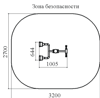
Рисунок 1. Минимальная зона безопасности тренажера «Кистевой»

1. Используйте изделие по назначению. 2. Дети до 14 лет допускаются до эксплуатации изделия только под руководством аттестованного инструктора. 3. Проводить визуальный осмотр изделия и проверять крепежные соединения - ежедневно. 4. Согласно ГОСТ Р 57538-2017 тренажер имеет зону безопасности См. рис. 1. Зона безопасности должна предоставлять пользователю достаточно места для того, чтобы использовать тренажер для предназначенных упражнений.